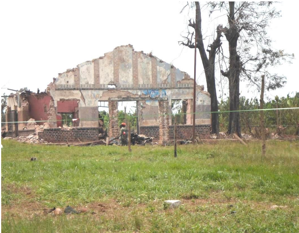
Ville de Mbuji-Mayi : ce qui reste d'un bureau de l'Armée, après l'explosion de l'entrepôt d'armes et munitions